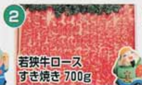
若狭牛ロール すき焼き 700g