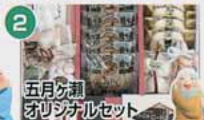
五月旬 オリジナルセット