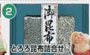
油昆布 とろろ昆布詰合せ