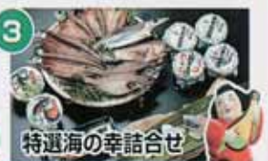
特選海の幸詰合せ