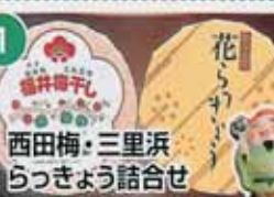
西田梅・三里浜 らっきょう詰合せ