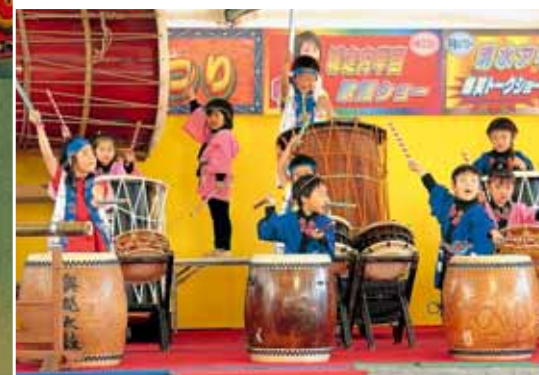
アドバンススクールの太鼓