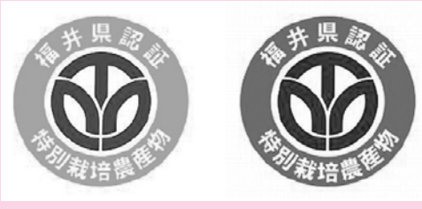
特別栽培農産物認証マーク

お問い合わせ 福井県奥越農林総合事務所 農業経営支援部 担当 山川・一川(イチカワ) ☎0779-65-1280(内線339)