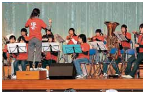
勝山市内中学校によるプラスバンドの競演と共演