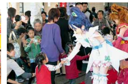
子ども達に人気のプリキュアショー