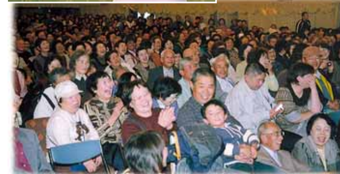
清水アキラさんの爆笑トークに大笑い