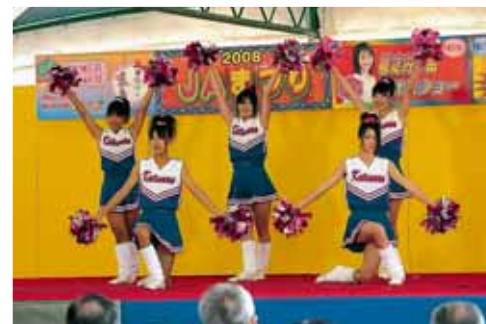
勝山南高校バントワリング部