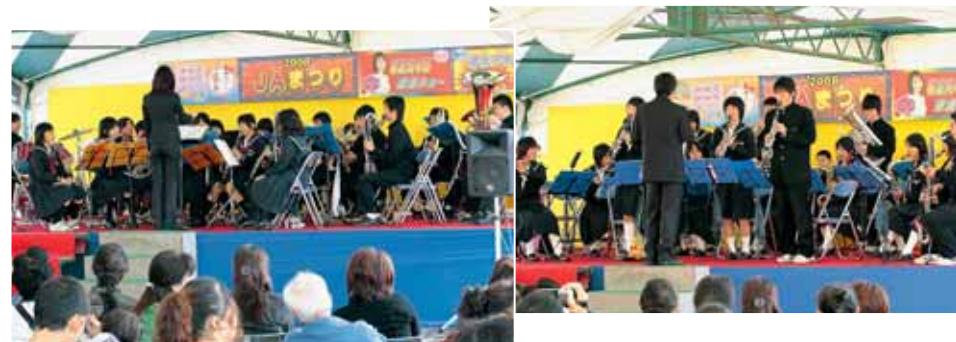
大野市内中学校プラスバンドの演奏