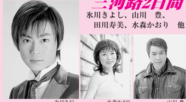
氷川きよし、山川 豊、田川寿美、水森かおり 他

旅行実施日／平成21年1月30日(金)～31日(土) 募集人員／80名 旅行代金／大人お一人様 29,800円 (4～5名にて1室) ※3名1室 お一人様3,000円増し 2名1室 お一人様5,000円増し 申込金／6,000円(旅行代金へ充当します) ※座席に限りがありますのでお早めにお申し込みください