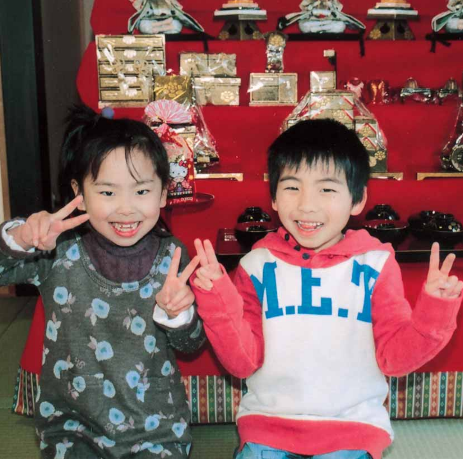
笑顔の暮らし耕します 「テラル」とは、「大地にやさしい」という意味で、テラ(地球、大地)というラテン語からの派生語で、農業を守り、自然を守り続けるというJAの基本姿勢を表現しています。