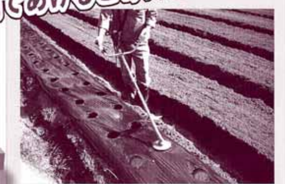
実際の穴あけ作業の様子