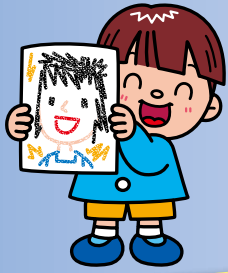
力作が並んだ展示会場