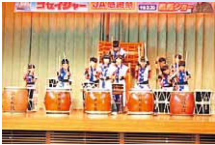
元気な太鼓の演奏