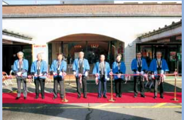
オープニングのテープカット