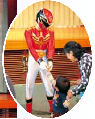
子供たちに大人気のゴセイジャーショー