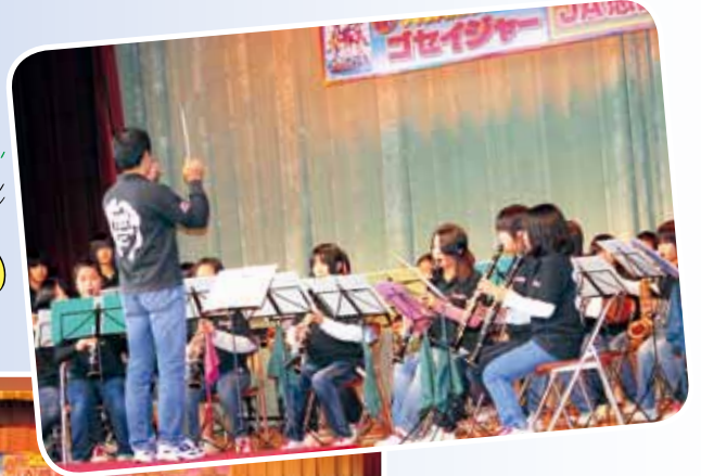
中学生による ブラスバンド