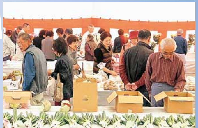
ずらりと並んだ農林産物品評会