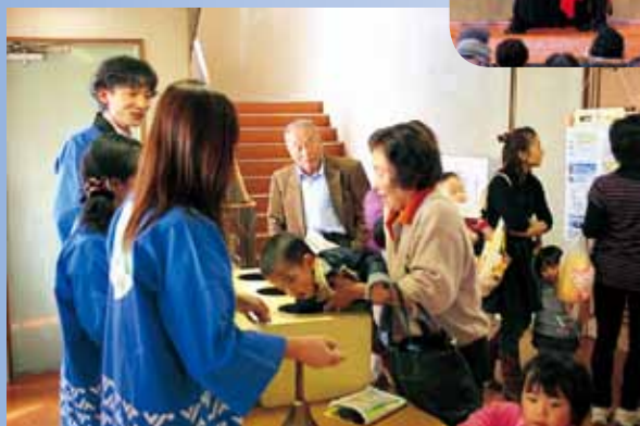
特等を狙って、抽選会